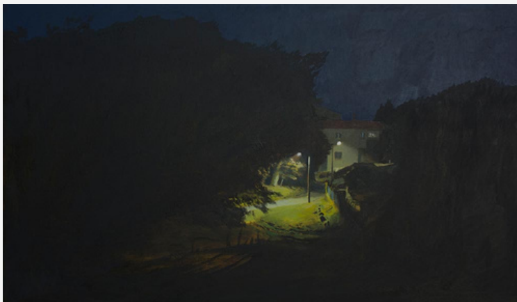
Mogor II, 2015. Juan Rivas

COMISARIADO: IGNACIO PÉREZ-JOFRE E SANDRA MG