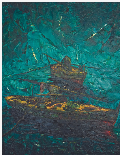
Dornas, ca. 1954. José Otero Baena

Otero Baena substituíu o pincel pola espátula para reflectir a paisaxe de Bueu, principalmente o mar e as escenas de pesca, distorsionadas conscientemente a través da luz e a cor.