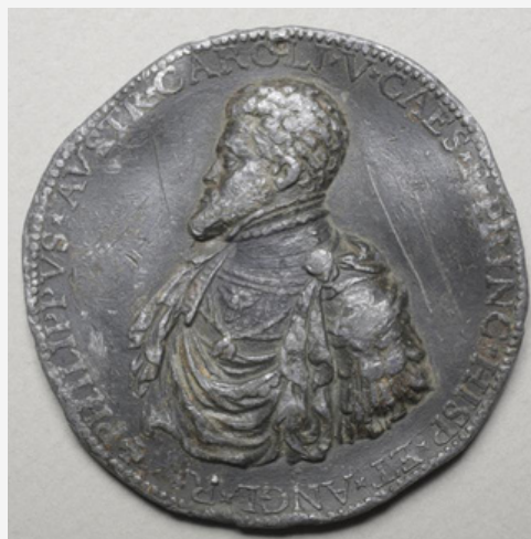
Medalla conmemorativa de Felipe II como Príncipe de España e Rei de Inglaterra, 1555.

Con motivo da celebración do Congreso Nacional de Numismática, o Museo exhibe pezas dun dos seus fondos máis importantes, a Colección Blanco Cicerón. Unha achega a unha figura por reivindicar, o coleccionista que sentou as bases da museoloxía galega.