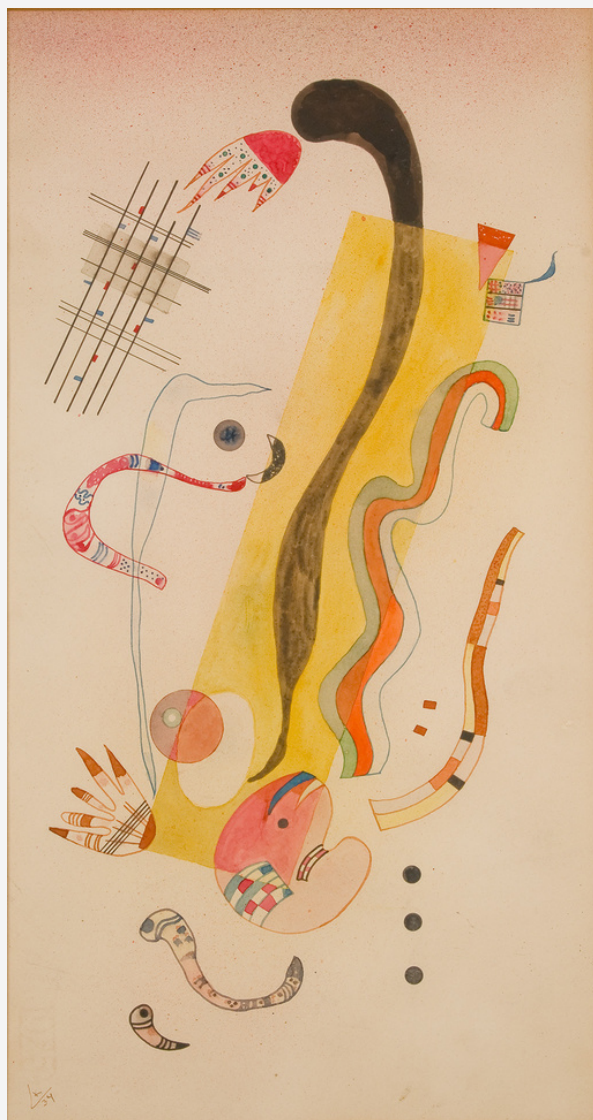
Rampant. 1934. Vasily Kandinsky